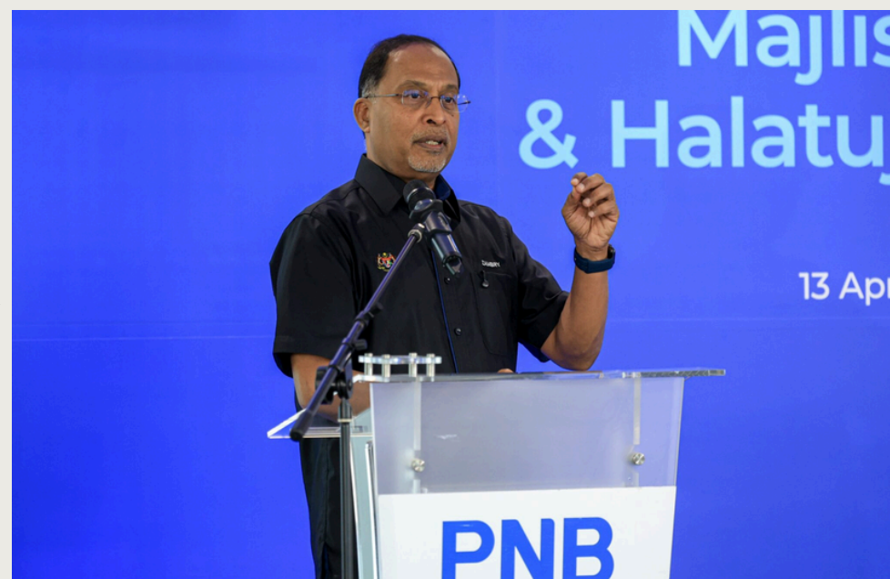
ZAMBRY Abd. Kadir berucap pada Majlis Pencapaian dan Hala Tuju Celik Madani di Menara Merdeka 118 di sini hari ini.

KUALA LUMPUR: Institusi pengajian tinggi (IPT) awam dan swasta diminta memantau harga makanan di kafeteria bagi memastikan ia kekal berpatutan dan tidak membebankan pelajar. Menteri Pendidikan Tinggi, Zambry Abdul Kadir, menegaskan bahawa terdapat pengusaha yang menetapkan harga mengikut kadar pasaran tanpa mengambil kira kemampuan pelajar, sekali gus memerlukan perhatian serius daripada pihak pengurusan universiti.