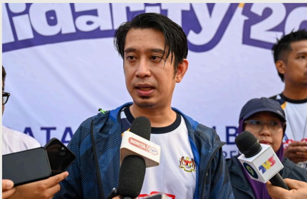
Timbalan Menteri Pendidikan Tinggi - Adam Adli Abdul Halim