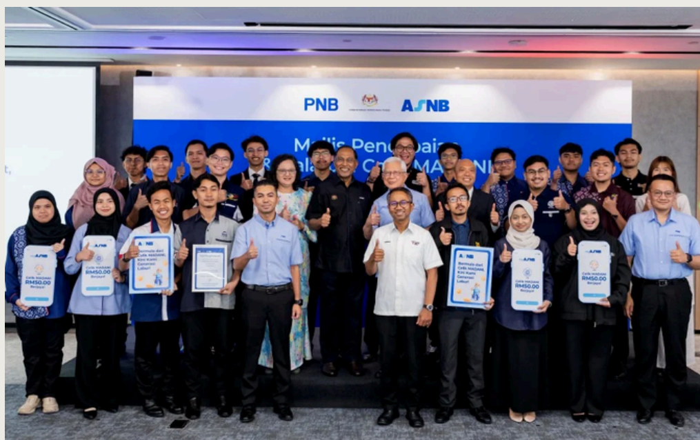
Menteri Pendidikan Tinggi, Datuk Seri Dr Zambry Abd Kadir bergambar pada Majlis Pencapaian dan Halatuju Celik MADANI di Menara Merdeka 118, hari ini.

KUALA LUMPUR: Kementerian Pendidikan Tinggi Malaysia (KPT) akan memperkenalkan inisiatif Menu Kasih Siswa dalam masa terdekat bagi membantu pelajar mendapatkan makanan pada harga berpatutan. Menterinya, Zambry Abdul Kadir, berkata usaha ini selaras dengan pendekatan kebajikan di institusi pengajian tinggi serta mengambil kira kemampuan pelajar, khususnya daripada golongan berpendapatan rendah. Beliau turut menggesa pengusaha kafeteria supaya lebih peka terhadap situasi kewangan pelajar dalam menentukan harga makanan.