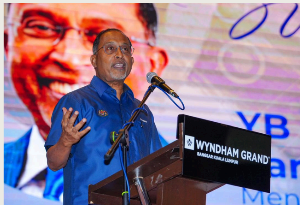
ZAMBRY Abd. Kadir menyampaikan ucapan perasmian Persidangan Public - Private Research Network (PPRN) 2026 di Wyndham Grand Bangsar.

KUALA LUMPUR: Kementerian Pendidikan Tinggi Malaysia (KPT) menegaskan tidak akan berkompromi terhadap sebarang bentuk rasuah atau penyalahgunaan kuasa di institusi pengajian tinggi. Menterinya, Zambry Abdul Kadir, menyatakan bahawa isu rasuah perlu dipandang serius tanpa mengira skala kerana ia melibatkan integriti serta tadbir urus institusi pendidikan negara. Gejala ini dilaporkan bukan sahaja berlaku dalam aspek pentadbiran dan kewangan, malah turut menjejaskan urusan akademik seperti pemberian markah, kelulusan kursus dan pengurusan geran penyelidikan.