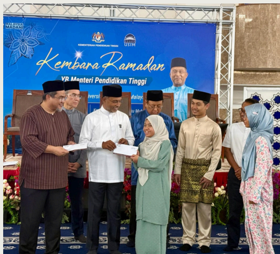
DR. Zambry Abd Kadir menyerahkan Sumbangan Kasih Ramadan kepada pelajar asnaf ketika Program Kembara Ramadan Bersama Menteri Pendidikan Tinggi dan Majlis Iftar Perdana Universiti Sains Islam Malaysia (USIM) di Kompleks Islam Tuanku Muhriz di Nilai, Seremban, hari ini.

Kementerian Pendidikan Tinggi (KPT) menegaskan bahawa pihaknya tidak akan berkompromi terhadap sebarang isu penghinaan agama yang berlaku di institusi pendidikan tinggi. Ketegasan ini susulan satu insiden melibatkan pelajar sebuah institusi pengajian tinggi awam di Pahang yang didakwa melakukan perbuatan menghina agama sehingga mencetuskan kebimbangan dalam kalangan masyarakat.