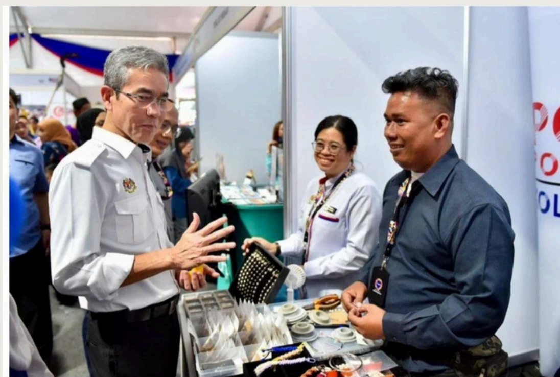
Anesee (kiri) beramah mesra bersama usahawan muda dan peserta pameran dalam lawatan rasmi beliau.

Sepanjang pelaksanaan Rancangan Malaysia Kedua Belas (RMK12), kadar bekerja graduan di Malaysia menunjukkan peningkatan yang memberangsangkan dengan trend positif sejak 2021. Kadar tersebut meningkat daripada 85.2% pada 2021 kepada 91.1% pada 2022, sedikit menurun kepada 90.9% pada 2023 sebelum melonjak semula kepada 92.5% pada 2024, manakala data bagi 2025 masih dalam proses dimuktamadkan. Perkembangan ini mencerminkan keupayaan graduan institusi pendidikan tinggi untuk menyesuaikan diri dengan keperluan semasa pasaran kerja yang semakin mencabar.