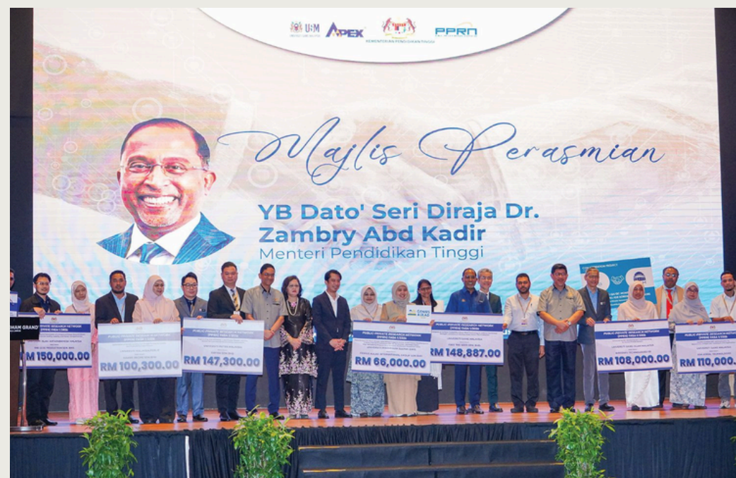
ZAMBRY Abd. Kadir bersama penerima surat tawaran dan cek syura geran Public-Private Research Network (PPRN) selepas merasmikan Persidangan PPRN 2026 di Wyndham Grand Bangsar, semalam.

Sehubungan itu, Kementerian Pendidikan Tinggi Malaysia (KPT) komited untuk memastikan setiap isu rasuah disiasat dan diambil tindakan sewajarnya bagi mengekalkan kepercayaan masyarakat terhadap institusi pendidikan tinggi. Usaha ini termasuk kerjasama dengan pihak berkuasa berkaitan serta penambahbaikan berterusan dalam sistem pengurusan dan pemantauan. Pendekatan tegas ini penting bagi memastikan IPT kekal sebagai institusi yang berintegriti, telus dan mampu melahirkan graduan berkualiti tinggi.