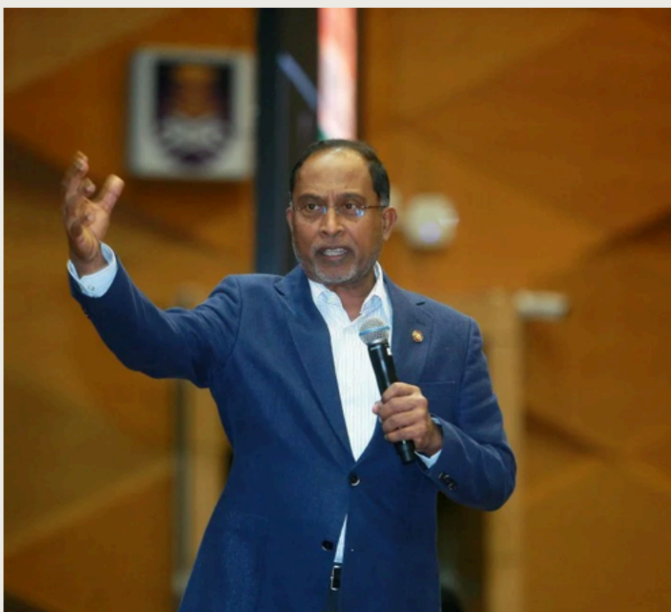
Menteri Pendidikan Tinggi, Datuk Seri Dr Zambry Abdul Kadir.

Oleh Berita Harian - Februari 25, 2026 @ 11:47am