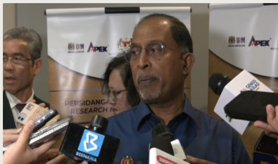
Menteri Pendidikan Tinggi Datuk Seri Dr Zambry Abd Kadir dalam sidang media selepas merasmikan Persidangan Public-Private Research Network (PPRN) 2026 di Kuala Lumpur.

KUALA LUMPUR: Kementerian Pendidikan Tinggi Malaysia (KPT) memaklumkan bahawa pelajar Malaysia di luar negara berada dalam keadaan selamat walaupun berdepan situasi geopolitik semasa. Menteri Pendidikan Tinggi, Zambry Abdul Kadir, berkata pihak kementerian bekerjasama rapat dengan Kementerian Luar Malaysia bagi memantau kebajikan dan keselamatan pelajar secara berterusan.