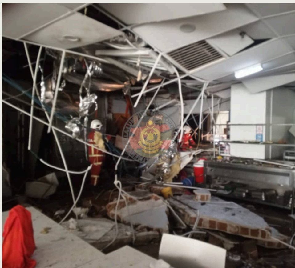
Keadaan sebuah universiti swasta yang terlibat dalam kejadian letupan gas isnin lalu.

PETALING JAYA – Kementerian Pendidikan Tinggi (KPT) mengarahkan sebuah universiti swasta di Jalan Semantan, Kuala Lumpur supaya menjalankan pemeriksaan keselamatan menyeluruh susulan insiden letupan gas yang berlaku di tingkat empat bangunan kampus berkenaan. Kawasan terjejas perlu disahkan selamat oleh pihak berkuasa sebelum digunakan semula, selain penyediaan sokongan kebajikan termasuk rawatan perubatan dan bantuan psikososial kepada semua mangsa terlibat.